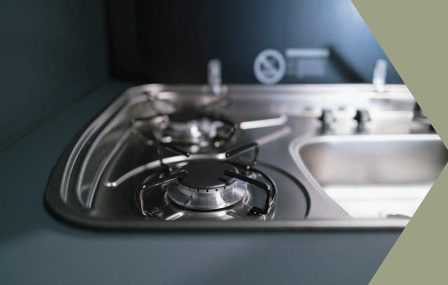
2-Flammen Kochfeld mit integrierter Spüle