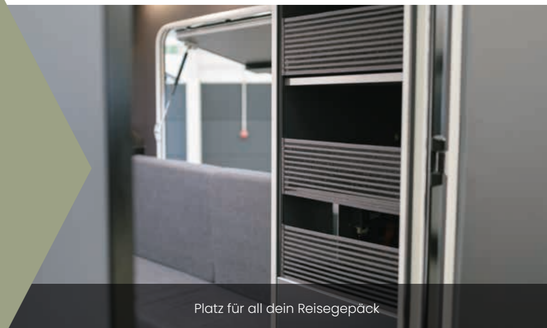
Platz für all dein Reisegepäck

Jetzt ist wirklich alles möglich: Die vanexxt pickupboxx vereint eine einzigartige Kompatibilität mit fast allen gängigen Pickup-Fahrzeugen mit einem unerwartet großen Raumgefühl und einem Leichtgewicht von nur 430 kg. Das fahrende Zuhause ist absolut Offroad-tauglich und überzeugt mit viel Stauraum, einem zeitlosen Look, wenig Schnickschnack und unschlagbarer Langlebigkeit dank der Verarbeitung hochwertigster, beständiger Materialien.