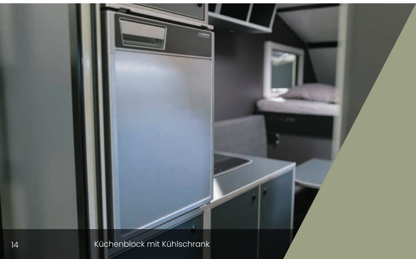
Küchenblock mit Kühlschrank