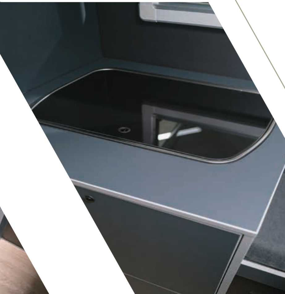
Extra großer Küchenblock