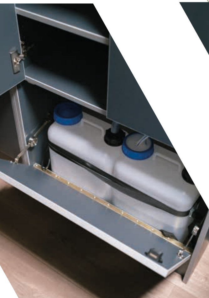
16 l Frisch- und Abwassertank