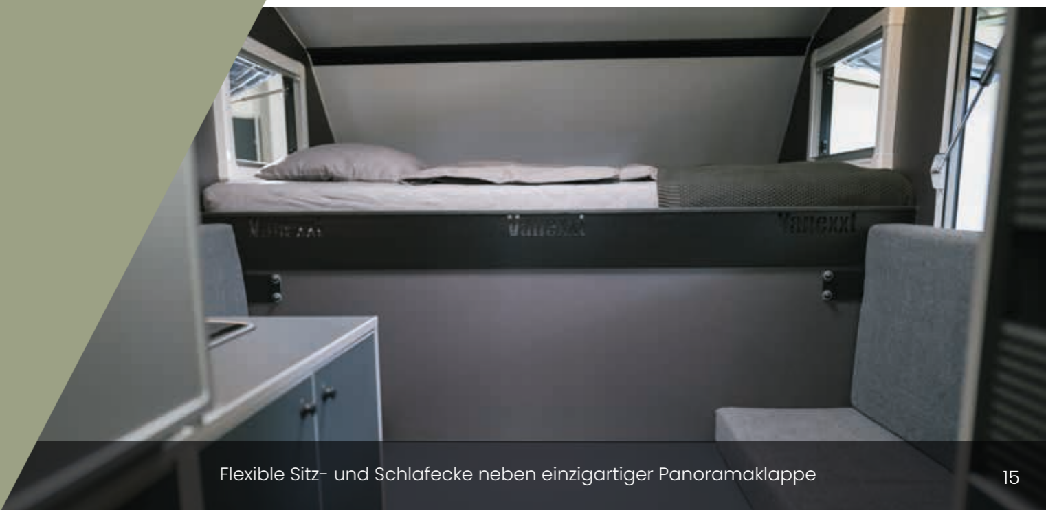
Flexible Sitz- und Schlafecke neben einzigartiger Panoramaklappe