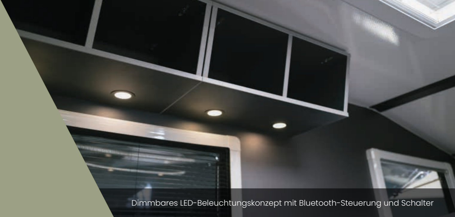
Dimmbares LED-Beleuchtungskonzept mit Bluetooth-Steuerung und Schalter