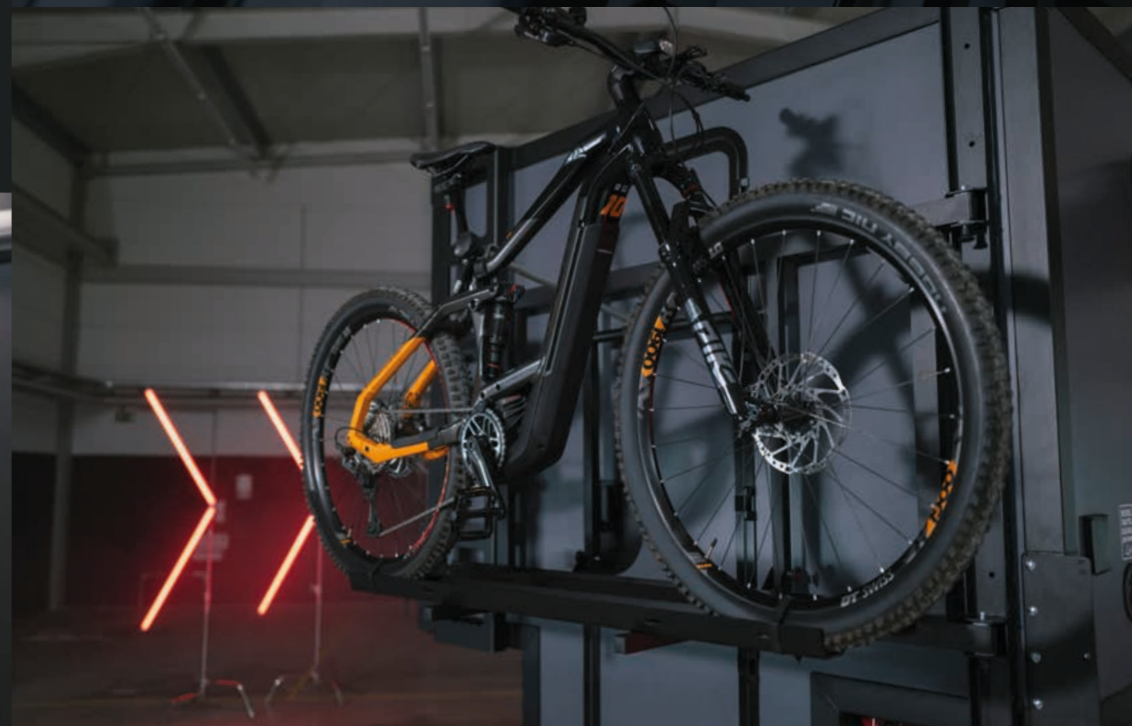
Fahrradträger für Heckträger für bis zu 3 Fahrräder