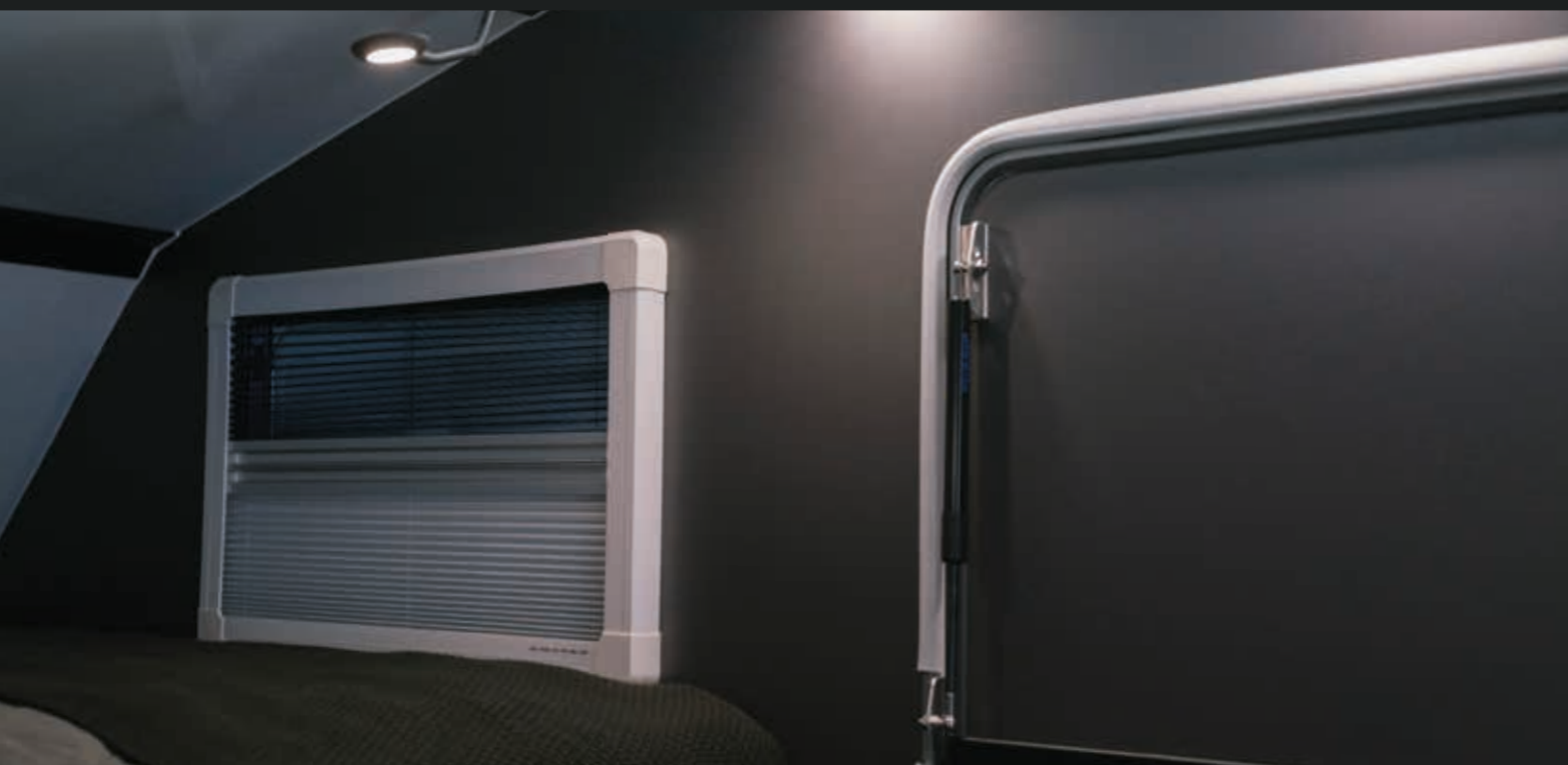
Dunkle Innenfolierung für einen besonders edlen Look