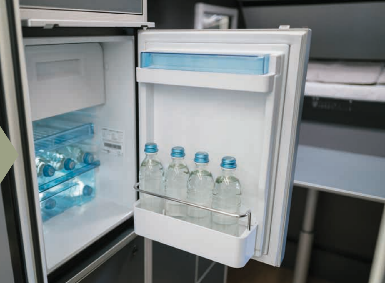
Kompressorkühlschrank mit 180° Öffnungswinkel