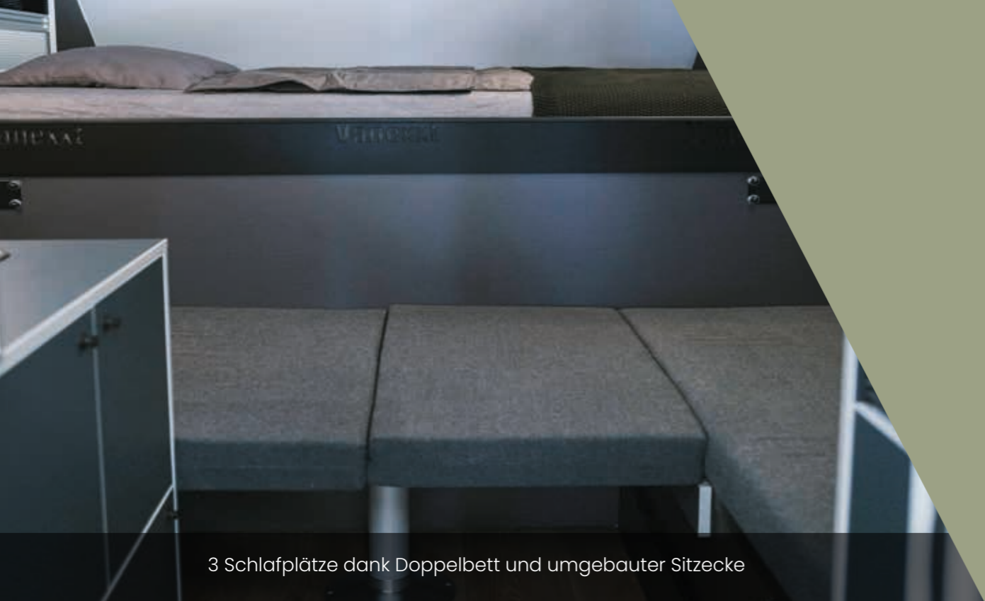
3 Schlafplätze dank Doppelbett und umgebauter Sitzecke