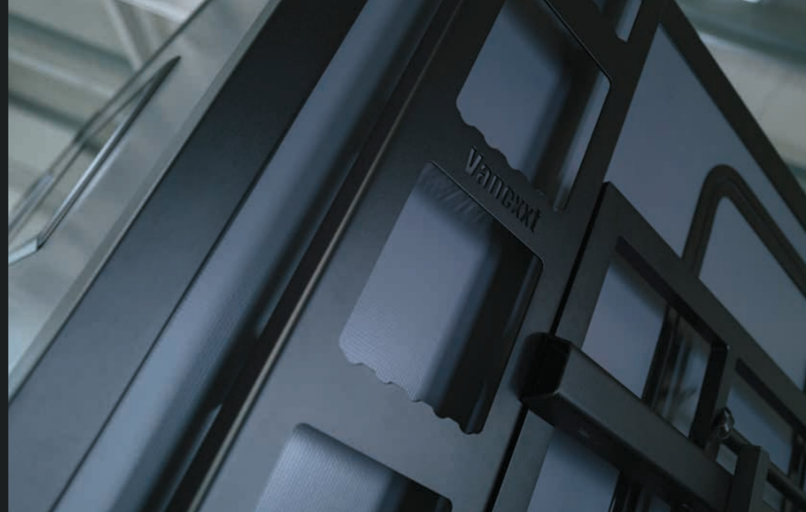
Standard-Heckleiter und optionaler schwenkbarer Heckträger